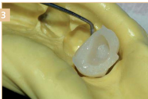
3 Удаление временного элемента из оттиска после застывания