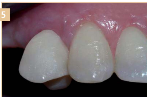
5 Окончательная версия работы