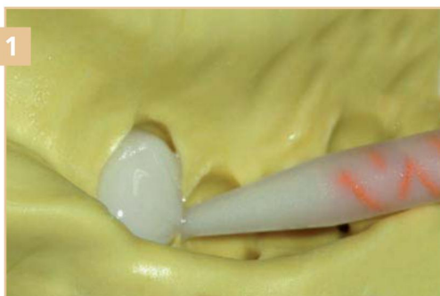
1 Нанесение ACRYTEMP на внутреннюю поверхность оттиска препарированной культи