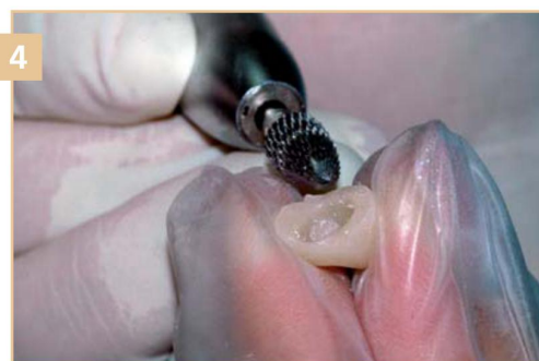
4 Финишная обработка временного элемента из ACRYTEMP