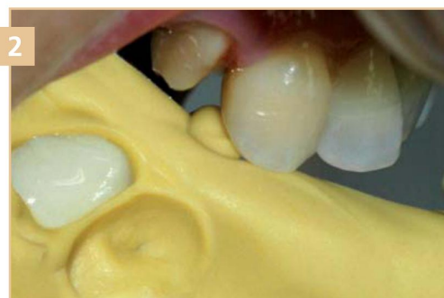
2 Переустановка оттиска на культе