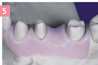
5 Фрагмент десневой маски после окончательной обработки