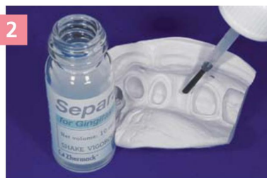
2 Нанесение сепаратора Gingifast Separator на матрицу из Zetalabor