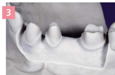
3 Участок мастер-модели, обработанный для нанесения Gingifast Elastic