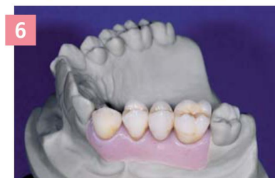
6 Готовая работа на мастер-модели