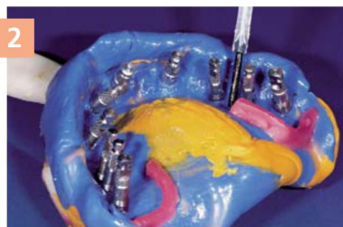
2 Нанесение сепаратора Gingifast Separator на оттиск