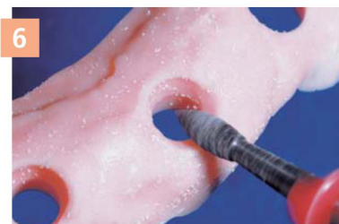
6 Простота фрезеровки