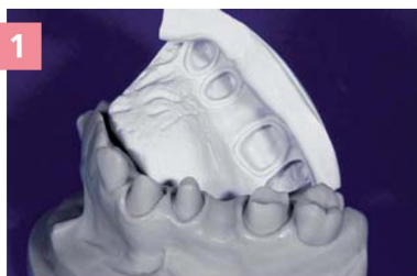
1 Мастер-модель с матричным оттиском из Zetalabor

GINGIFAST ELASTIC позволяет получить эстетический результат благодаря своей полупрозрачности и наличию васкулярных прожилок, придающих ему натуральный вид.