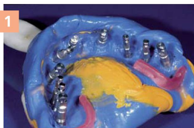
1 Подготовка оттиска

Сбалансированная твердость облегчает фрезеровку краев во время финишной обработки десневой маски на модели.