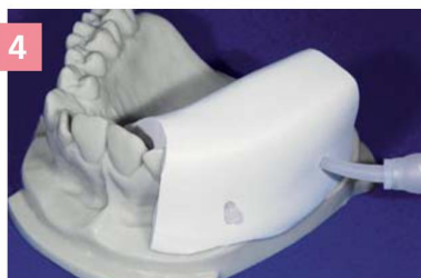
4 Установка матрицы из Zetalabor на модель и введение Gingifast Elastic