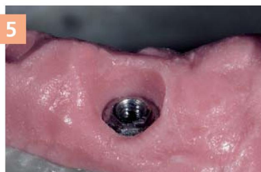
5 Фрагмент воспроизведенной десны