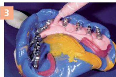
3 Фрагмент носика канюли, погруженного в материал во время выдавливания