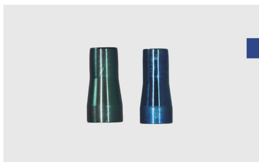
Стоппер для прямого аппликатора для контроля степени захвата пина