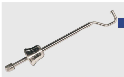
Аппликатор лингвальный для установки любых пинов Osteosynt