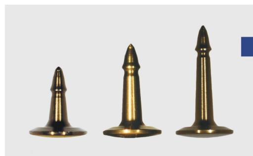
Титановый пин Osteosynt EXS усиленный, анодированный (бронзовый), стерильный