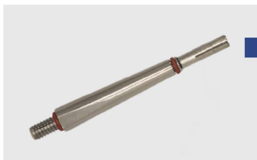
Сменная насадка для прямого аппликатора