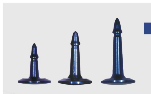
Титановый пин Osteosynt анодированный (синий), стерильный