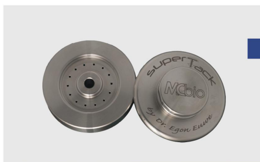
Контейнер для пинов для хранения и установки любых пинов Osteosynt