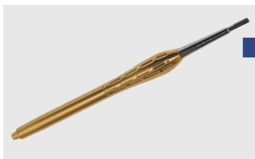
Аппликатор прямой для установки любых пинов Osteosynt