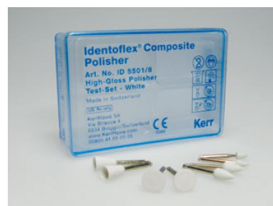
Identoflex Composite – ID 5501/8 набор полиров для зеркального блеска