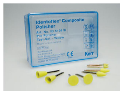
Identoflex Composite – ID 5101/8 набор полиров для пред- варительной полировки