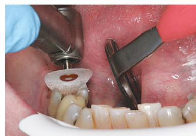
Короткий дискодержатель удобно использовать в условиях недостатка пространства