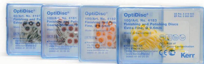
Дополнительные упаковки OptiDisc