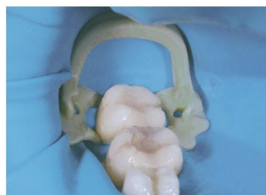
Клиническое использование OptiDam™ и SoftClamp™

Абразивное покрытие уменьшает риск ротации и травмирования