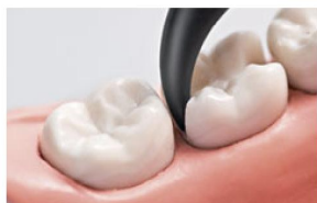
Маленький диаметр специально разработанной унидозы с материалом для системы SonicFill™ обеспечивает легкий доступ к полости. В то же время оптимальный угол изгиба унидозы обеспечивает доступ к любой части зуба