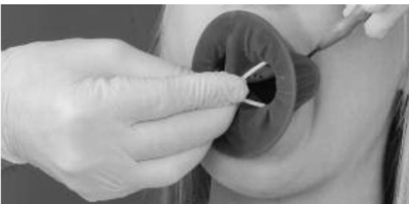
Фото 2: Правильное удерживание интраорального кольца между большим и средним пальцами. Кольцо при этом слегка сжато.

Удерживая интраоральное кольцо, следите за тем, чтобы оно не полностью выходило из латексного мешочка.