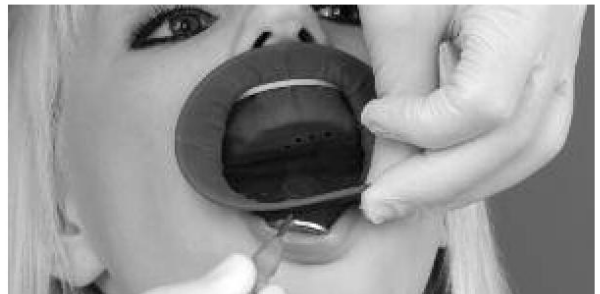
Фото 3: После того, как интраоральное кольцо было расположено за обоими углами рта, его необходимо завести за верхнюю и нижнюю губы.