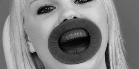
Фото 1. Надетый OptraDam Plus