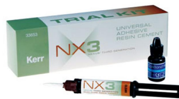
NX3 – пробный набор (Test-me Kit) 33653