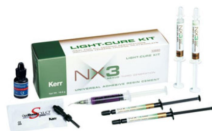
NX3 – светоотверждаемый набор 33682