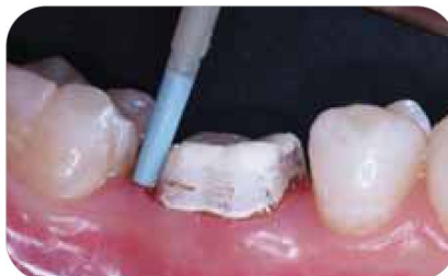
Удаление временного цемента с помощью инструмента OptiClean фирмы Kerr.