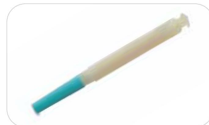
OptiClean Масштаб 2:1