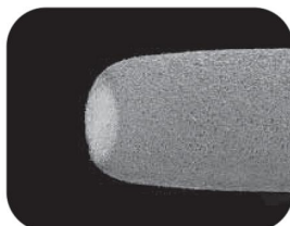
500 мкм Увеличение: 55x