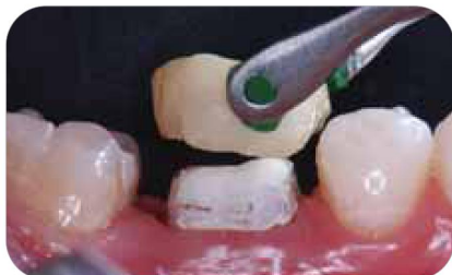
Удаление временной реставрации с препарированного зуба.

До настоящего момента эффективной методики удаления временного цемента не существовало. Но теперь у вас есть инструмент OptiClean фирмы Kerr для удаления временного цемента и загрязнений.