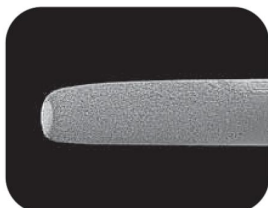
2 мм Увеличение: 17x