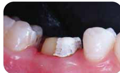
Превосходный результат использования инструмента OptiClean фирмы Kerr.