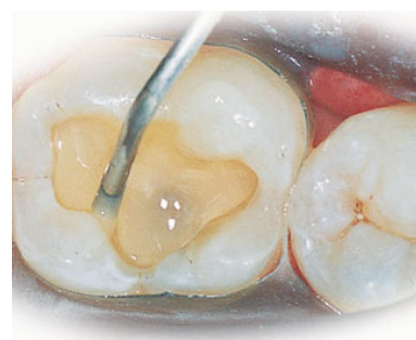
Revolution™ Formula 2 используется как прокладка при реставрации полости I класса